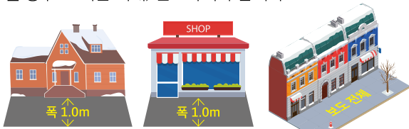
집 앞에 내린 눈 상가 건물 앞에 내린 눈 보도 위에 내린 눈

눈을 치우는 시기는 눈이 그친 때로부터 주간은 4시간 이내, 야간은 다음날 오전 11시까지(단, 1일 내린눈이 10cm 이상 일 경우 24시간 이내) 완료하여야 합니다.