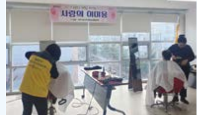
구의1동 지역사회보장협의체 사랑의 이미용 봉사