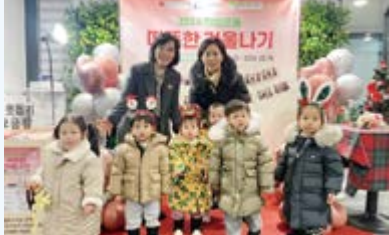
꼬마사랑 어린이집 성금 전달