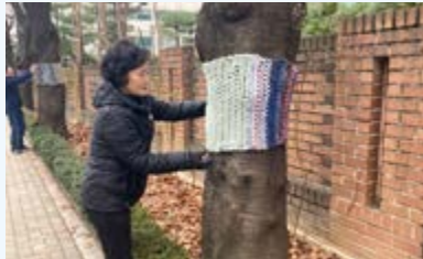
가로수 '장미 뜨개옷' 입히기