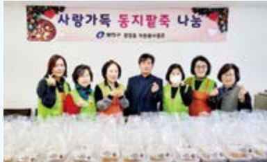
광장동 자원봉사캠프 사랑 가득 동지 팔죽 나눔