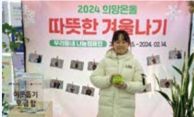
김○○ 학생 사랑의 기부금 전달