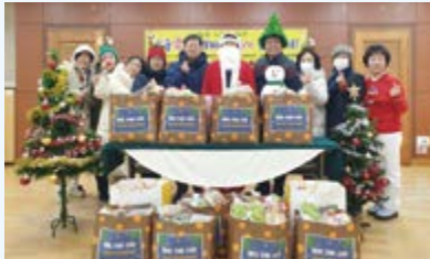
자양2동 주민자치위원회 '사랑애 희망보따리'