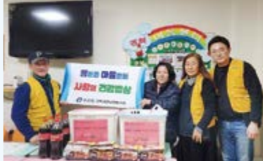
중곡3동 지역사회보장협의체 '사랑의 건강밥상' 진행