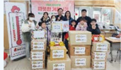
점프스타 줄넘기클럽 라면 기부