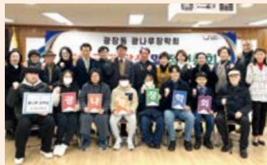
# 광장동 광나루장학회 장학금 전달