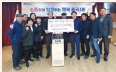
# 중곡3동 중곡3동 직능단체연합 윗놀이 대회 수익금 기부