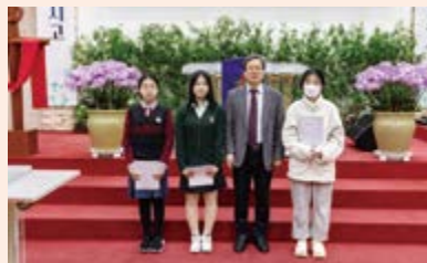
# 중곡4동 중곡동교회 장학금 전달