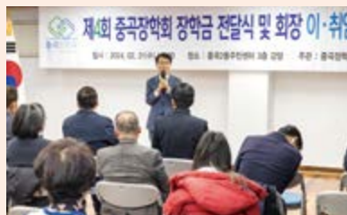
# 중곡2동 중곡장학회 장학금 전달