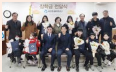
# 화양동 화양동 새마을금고 장학금 전달