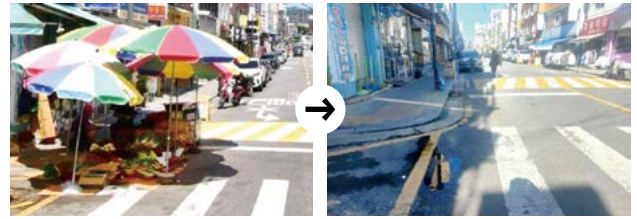
▲ 좌판 노점 정비 전

앞으로도 광진구는 원칙에 기반한 노점정책을 토대로 불법 노점을 정비하여 구민의 보행권을 향상시키고, 생계형 운영자에 대해서는 법의 테두리 안에서 새 출발할 수 있도록 적극 지원하겠습니다.