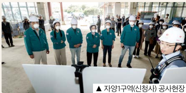
▲ 자양구역(신성사) 공사현장