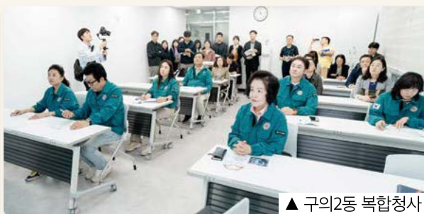
▲ 구의2동 복합청사