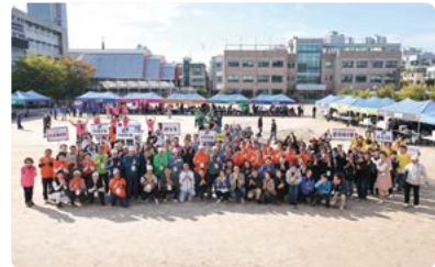
제1회 광진구 동 체육연합회 한마음 체육대회