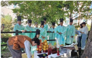
제11회 느티마을 한마당 축제