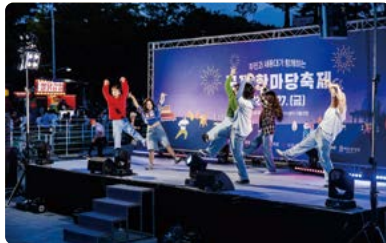
주민과 세종대가 함께하는 군자 한마당축제