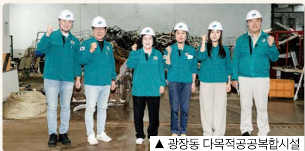
▲ 광장동 다목적공공복합시설