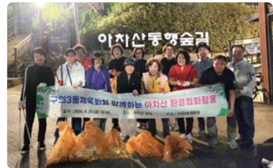
구의3동체육회 아차산 환경정화활동 실시