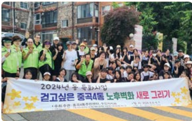
견고 싶은 중곡4동 노후벽화 새로 그리기