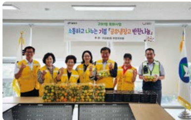
구의1동 공유냉장고 반찬나눔 행사