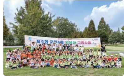
제9회 자양4동 영유아 그림소품