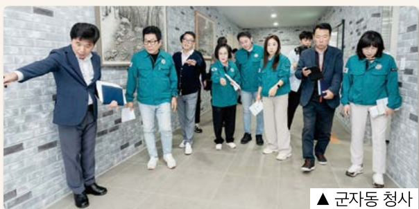
▲ 군자동 청사