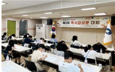
책 펴는 동네 자양3동 독서감상문 대회