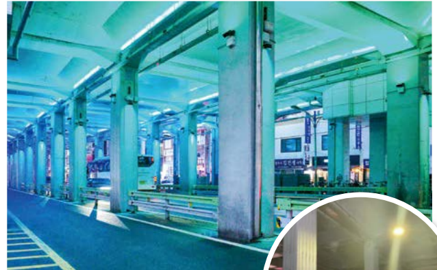
▲▼ 경관조명 개선 후