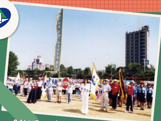
2004년 제9회 구민의날 한마음 체육대회

※ 보내주시는 분들 중 선정된 분께는 사진 소개와 함께 소정의 상품을 드립니다.