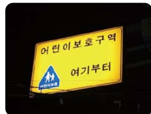
LED 발광형 표지판