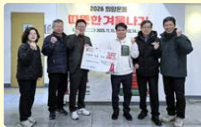
자양2동 자양현대3차아파트, 이웃돕기 성금 100만 원 기부