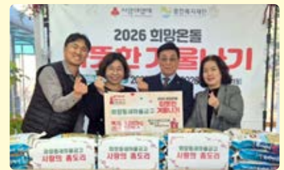
화양동 새마을금고, 사랑의 줌도리 후원물품 전달