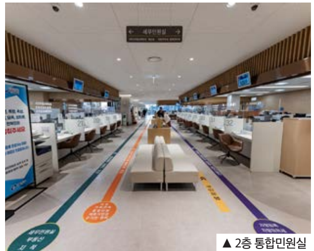
▲ 2층 통합민원실