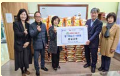
중곡2동 통일교회, 저소득 주민에 쌀·라면 기부