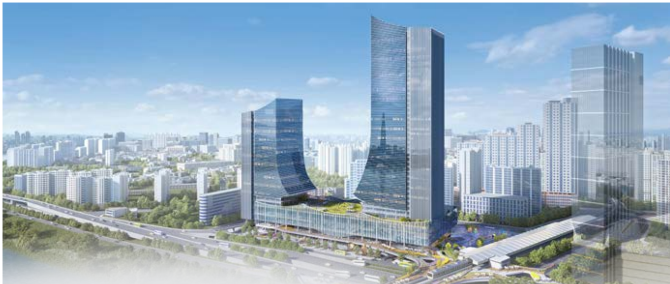
▲ 동서울터미널 현대화 사업 조감도

광진구가 동서울터미널 현대화 사업의 가장 큰 과제였던 임시터미널 조성 문제를 주민과의 진정성있는 소통 끝에 해결했습니다. 주민 여러분이 아끼는 구의공원을 그대로 유지하며 '테크노마트 및 기존 터미널 부지'를 활용하는 최적의 대안을 마련했습니다.